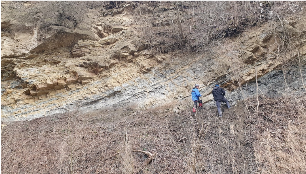
Fig. 7. Vedere de ansamblu asupra secțiunii 6 de pe Valea Stăuini (stânga – mijloc - jos) și detaliu cu depozitele care află în cadrul acestei secțiuni (dreapta).