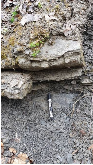
Fig. 5. Detaliu asupra depozitelor care aflorază în cadrul secțiunii 4 de pe Valea Stăuini