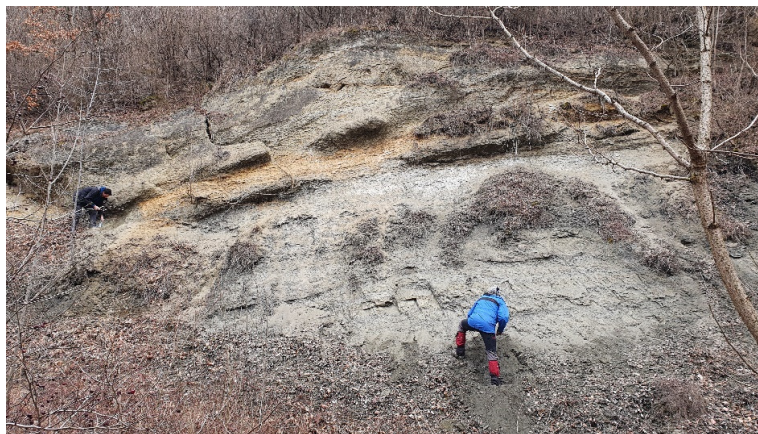
Fig. 3. Vedere de ansamblu asupra secțiunii 2 de pe Valea Stăuini