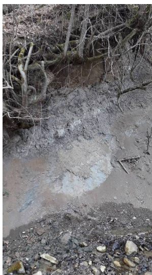
Fig. 2. Secțiunea 1, din avalul Văii Stăuini – alternanță de argile și gresii