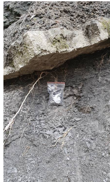
Fig. 4. Vedere de ansamblu asupra secțiunii 3 (stânga - mijloc) de pe Valea Stăuini și detaliu cu depozitele care afloră în cadrul acestei secțiuni (dreapta).