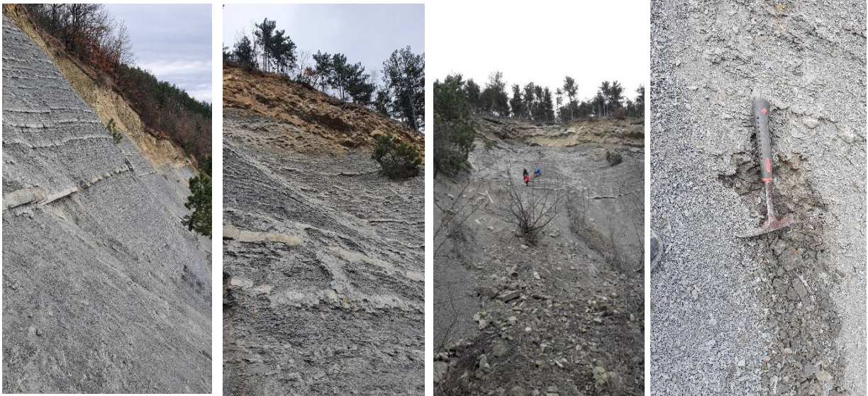
Fig. 9. Vedere de ansamblu asupra secțiunii 8 de pe Valea Stăuini (stânga – mijloc) și detaliu cu depozitele care află în cadrul acestei secțiuni (dreapta).