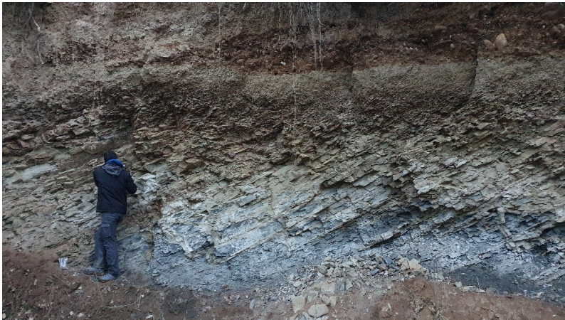
Fig. 10 . Vedere de ansamblu asupra depozitelor care află în cadrul secțiunii 9 de pe Valea Stăuini.