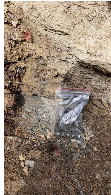
Fig. 6. Vedere de ansamblu asupra secțiunii 5 (stânga) de pe Valea Stăuini și detalii cu depozitele care aflorază în cadrul acestei secțiuni (mijloc - dreapta).